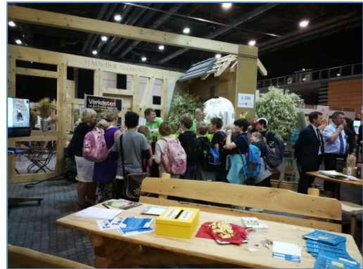
Werbematerialien mit Jahreskalender und Werbeflyer Kiste Kyffhäuser Spezialitäten und Eindruck vom Stand Grüne Tage Thüringen