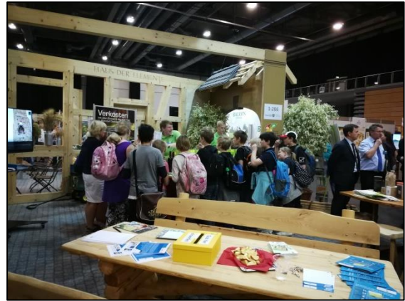
Verbrauchermesse Grüne Tage Thüringen

Erfreulicherweise wurde auch ohne spezielle Aktivitäten der RAG über verschiedene Projekte, die mittels Förderung realisiert wurden, in der lokalen Presse berichtet. Zu nennen sind beispielsweise die Vorhaben Klosterscheune Dietenborn und Mühle in Immenrode.