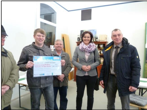
Förderscheckübergabe Bahnhof Donndorf