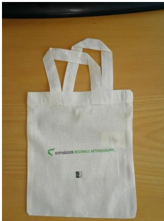
Stoffbeutel für reg. Produkte