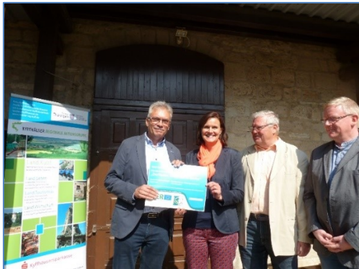
Übergabe Förderurkunde Hofladen Berka