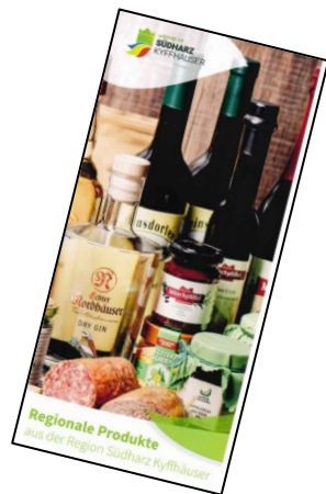
Mobiler Hofladen und Begleitflyer

Eine Fortsetzung gab es im Rahmen der LEADER-Kooperation „Touristische Inwertsetzung des Unstrut-Radweges“. Der Projektträger, der Unstrutradweg e.V., führt verschiedene Marketingaktivitäten durch und erstellt eine Broschüre mit Angeboten rechts und links der Trasse. LEADER-Partner hier sind die RAGn Eichsfeld, Unstrut-Hainich e.V. und Sömmerda-Erfurt e.V.