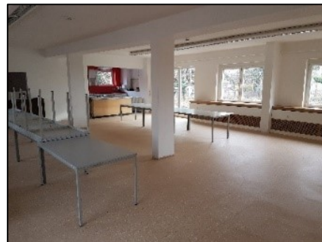
saniertes Vereinsraum mit Küchenzeile

Um die Geschichte von Friedrich von Hardenberg, dem frühromantischen Dichter Novalis, und seine häufigen Ritte von Bad Tennstedt zum Grüninger Schloss, wo seine Geliebte und spätere Verlobte Sophie von Kühn wohnte, erlebbar zu machen, entschieden sich die Städte Clingen und Greußen, gemeinsam ein Projekt zur Förderung einzureichen, das den Weg von Novalis nachzeichnet und interessierte Wanderer und Spaziergänger leitet sowie an ausgewiesenen Orten über Besonderheiten informiert.