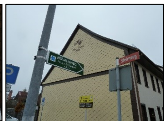
neue Infotafeln und Wegweiser für den Novalisweg in Clingen und Greußen

Hier investieren Europa und der Freistaat Thüringen in die ländlichen Gebiete