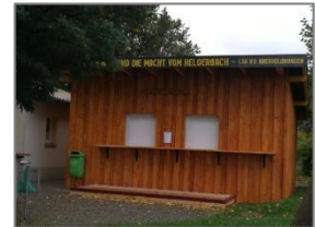
Lager- und Verkaufsraum