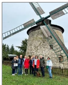
Delegation informiert sich über LEADER-Projekte