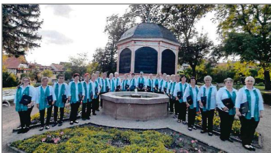
Frankenhäuser Frauenchor im neuen Gewand

Stellvertretend steht beispielsweise der Frankenhäuser Frauenchor, der ein einheitliches Outfit und Chormappen erhielt, um ein harmonisches Erscheinungsbild zu bieten, wenn er in Leipzig beim Gewandhausingen auftritt und die Region repräsentiert. Dies unterstützt auch das Gemeinschaftsgefühl im Chor, der das einheimische Publikum ebenfalls erfreut und zum kulturellen Leben in der Region aktiv beiträgt.