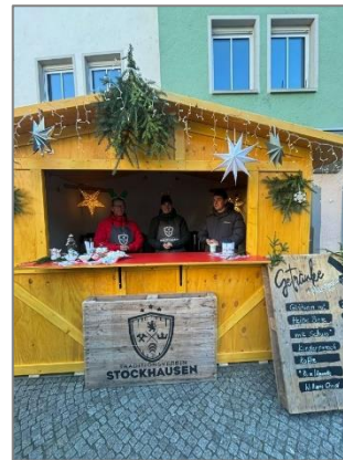
Holzhütte auf dem Adventsmarkt

Ein weiteres Beispiel für ehrenamtliches Engagement ist ein noch junger Verein, der sich der Traditionspflege in Stockhausen verpflichtet. Bei verschiedenen Veranstaltungen aktiv, wird zukünftig eine Holzhütte, die auf- und abgebaut werden kann, den Ausschank ermöglichen. Die Hütte wurde in Eigenleistung von den Vereinsmitgliedern aufgebaut und direkt beim Adventsmarkt eingeweiht.